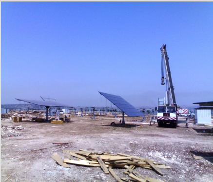
Bilder der Referenzanlagen Sizilien/Ragusa

Die Gesamtinvestition beträgt 26 Millionen Euro zuzüglich Erwerbsnebenkosten.